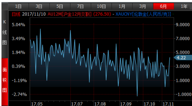
图 3、沪金 12 月-伦敦金（RMB/g）溢价近期震荡小幅下跌 图 4、沪银 12 月-伦敦银（RMB/kg）溢价近期震荡下跌